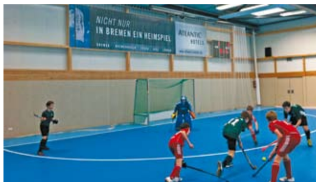
So sehen Gewinner aus: Bremer Hockey Club (oben) und Eisbären Bremerhaven in Aktion

Tipp: Am 23.8.2013 findet zum Saisonauftakt das Allstar Game der Eisbären in der Stadthalle Bremerhaven statt: Unter dem Titel „Future meets Past“ trifft die aktuelle Mannschaft auf eine Auswahl ehemaliger Profis. Anschließend wird mit Radio Bremen 4 und DJ gefeiert. +