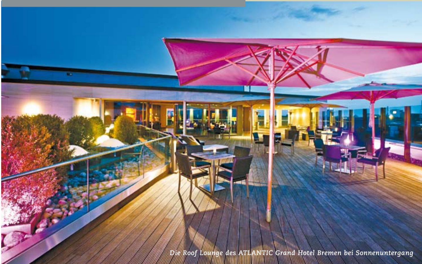
Die Roof Lounge des ATLANTIC Grand Hotel Bremen bei Sonnenuntergang